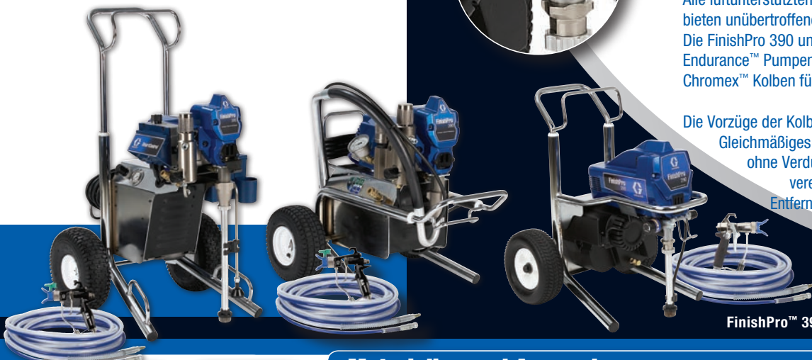
FinishPro™ 395 - FinishPro™ 390 - FinishPro™ 290

Die Vorzüge der Kolbenpumpe: Gleichmäßiges Pumpen auch viskosere Materialien ohne Verdünnung. QuikAccess™ Einlassventile vereinfachen das Reinigen oder das Entfernen möglicher Fremdkörper.